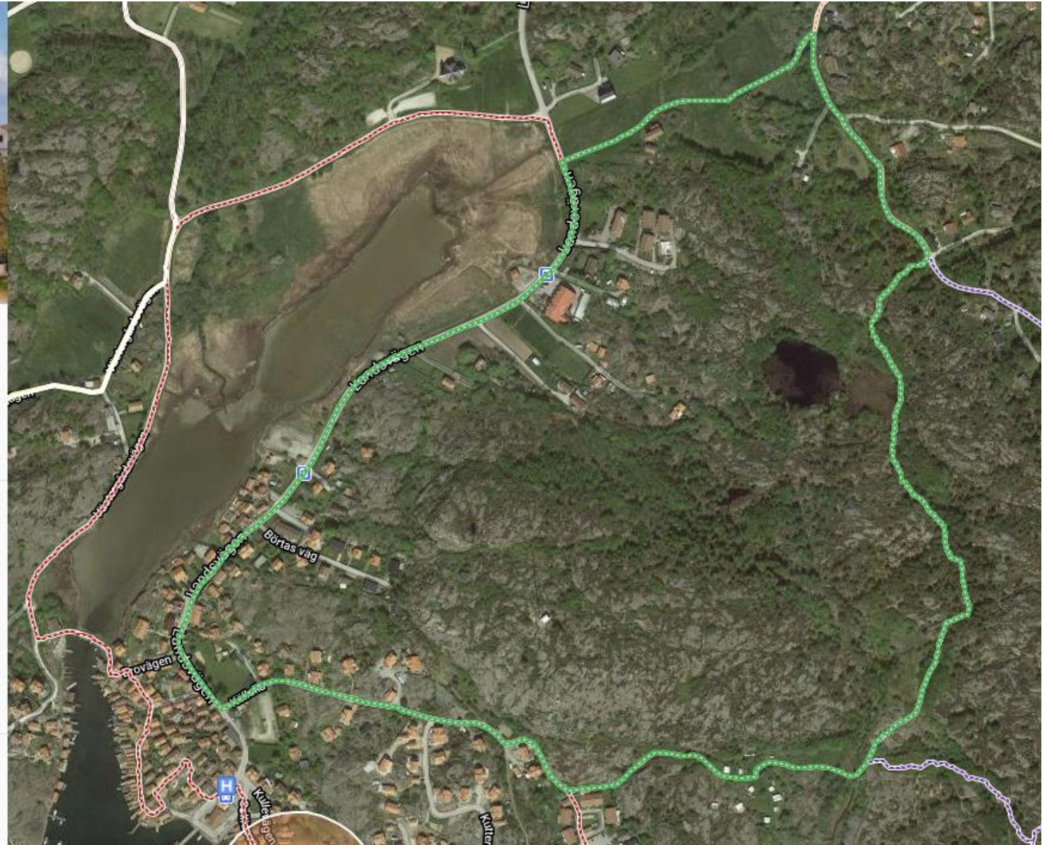
Led 4 – Långeland, grön slinga