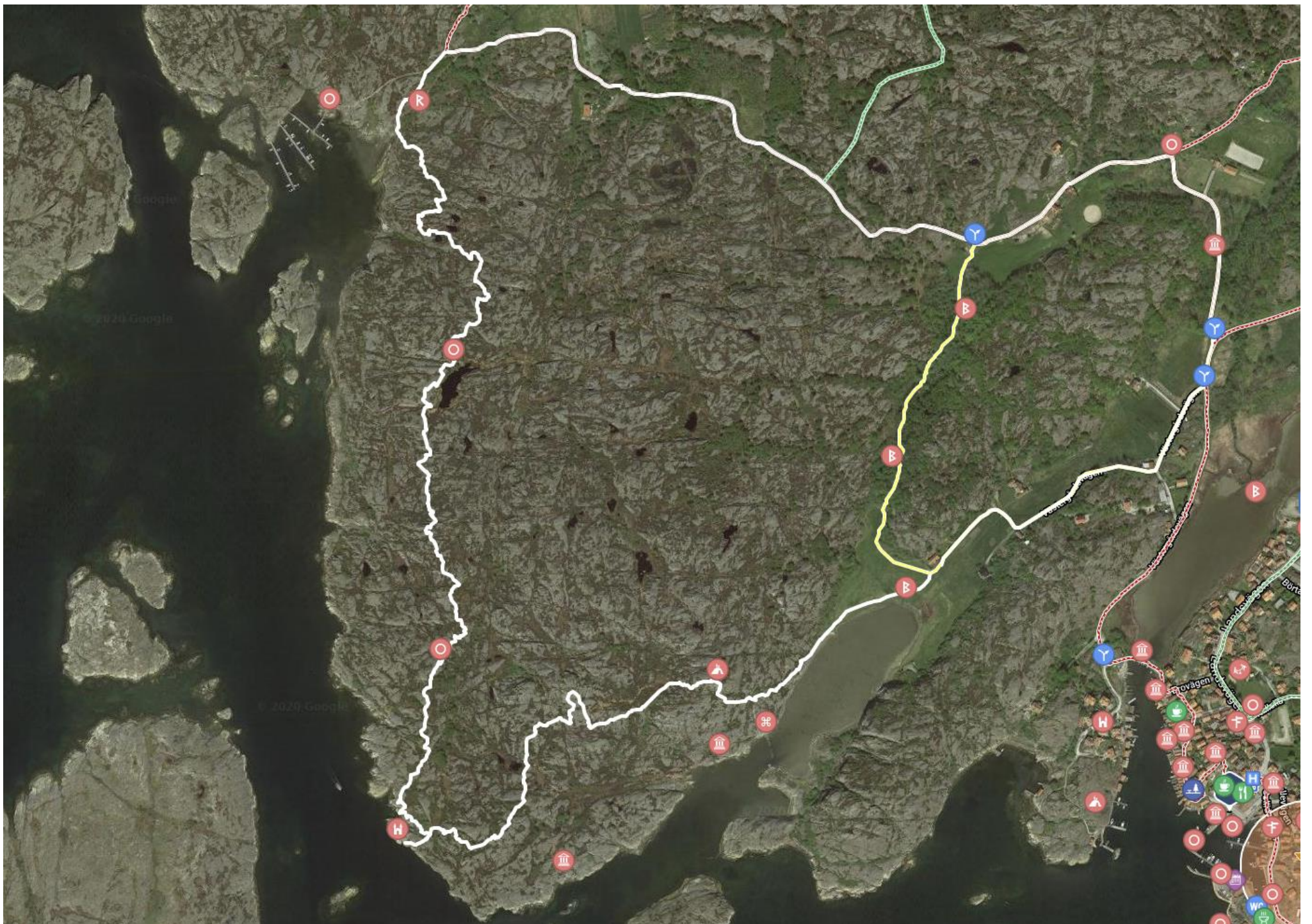
Porsnäsleden, förstorad karta